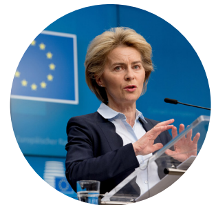
Präsidentin von der Leyen, Rede zur Lage der Union 2020

“Wo ist das Wesen der Menschheit, wenn Roma tagtäglich aus der Gesellschaft ausgeschlossen werden, und andere aufgrund ihrer Hautfarbe oder ihres Glaubens benachteiligt werden?”